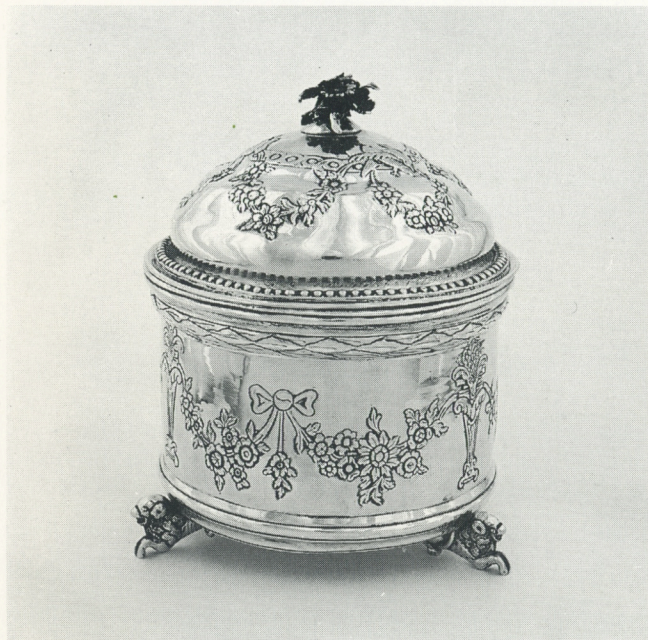
H. Jakobi, Silberner Tabakstopf, um 1780, Schenkung 1986

Seit 1960, als das Wohnhaus des Malers B. C. Koekkoek dem Städtischen Museum Kleve als nobles Heim übergeben wurde, ist das Museum durch bedeutende Kunstausstellungen zu einem kulturellen Zentrum am Niederrhein geworden.