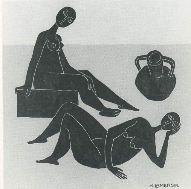
Hanns Lamers, Frauen, 1955, Hinterglasbild, Schenkung 1982

Jedes Mitglied ist willkommen. Sie brauchen nur die beiliegende Beitrittserklärung auszufüllen. Der Mindestmitgliedsbeitrag ist für: Einzelmitglieder DM 30,-, Ehepaare DM 45,-, Firmen DM 100,-, Schüler und Studenten bis zum 25. Lebensjahr DM 5,-. Natürlich können Sie den Verein auch durch Spenden unterstützen; über diese Beträge werden Spendenbescheinigungen ausgestellt. Spendenkonto Nr. 5027 685 Sparkasse Kleve, Bankleitzahl 324 500 00. Der Freundeskreis bedankt sich recht herzlich für Ihre Mitarbeit und Ihre finanzielle Förderung.