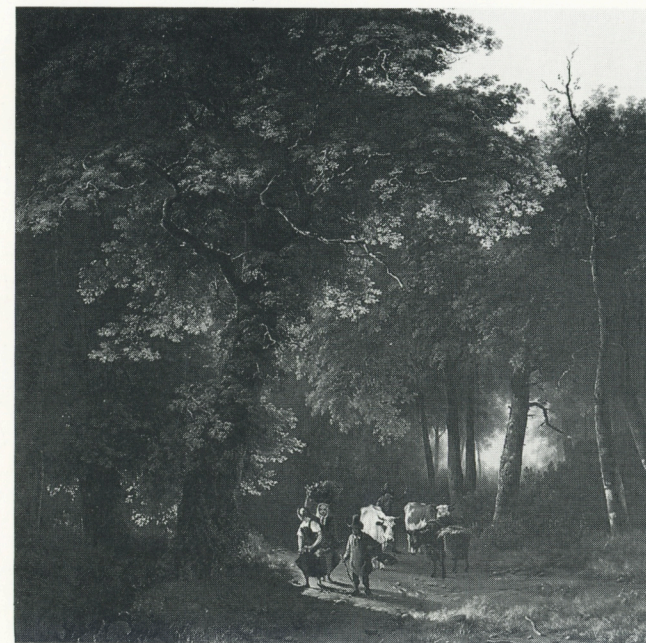
W. Bodeman, Im Reichswald, 1840, Ölbild, Schenkung 1985

Ein besonderes Anliegen ist die räumliche Erweiterung des Museums. Das in der Mitte des 19. Jahrhunderts erbaute klassizistische Wohnhaus ist in den vergangenen siebenundzwanzig Jahren zu eng geworden, um die Sammlungen und Wechselausstellungen angemessen darstellen zu können. Neue Räumlichkeiten würden es ermöglichen, die breitgefächerten Sammlungen, die gegenwärtig noch im Magazin schlummern, der Öffentlichkeit zugänglich zu machen!