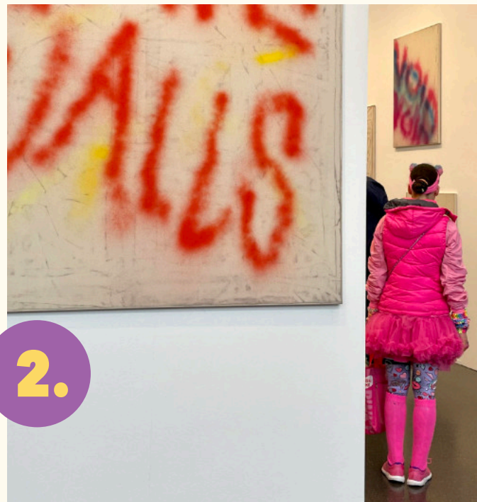
Abb.: ART Düsseldorf 2023, Foto: Helga Diekhöfer

Link zu Informationen über diese Tagesfahrt