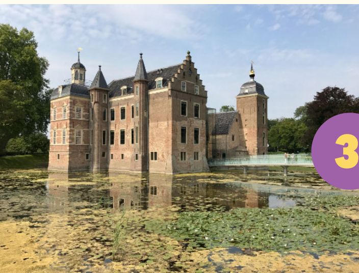
Abb.: Kasteel Ruurlo

Link zu Informationen über dieser Tagesfahrt