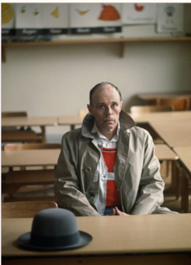
Abb.: Joseph Beuys im FvS, 1978

Wir laden Sie herzlich ein zur öffentlichen Vorstellung des Buches BEUYS LAND am Mittwoch, den 17. April um 19.30 Uhr im Café Moritz. Der Fotograf Gerd Ludwig und der Kulturwissenschaftler Frank Mehring werden anwesend sein und auf Wunsch die Bücher signieren.