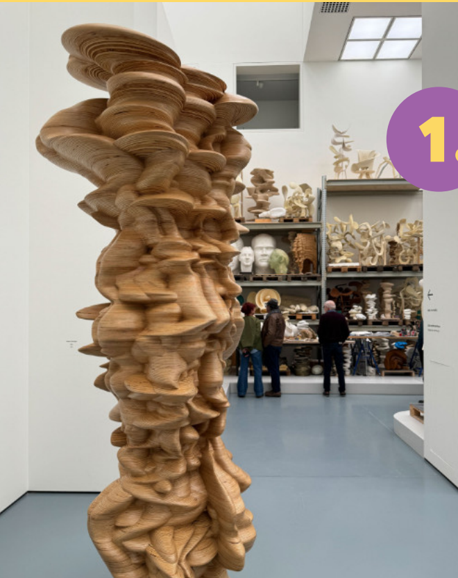
Abb.: Ausstellung Tony Cragg. Please Touch.