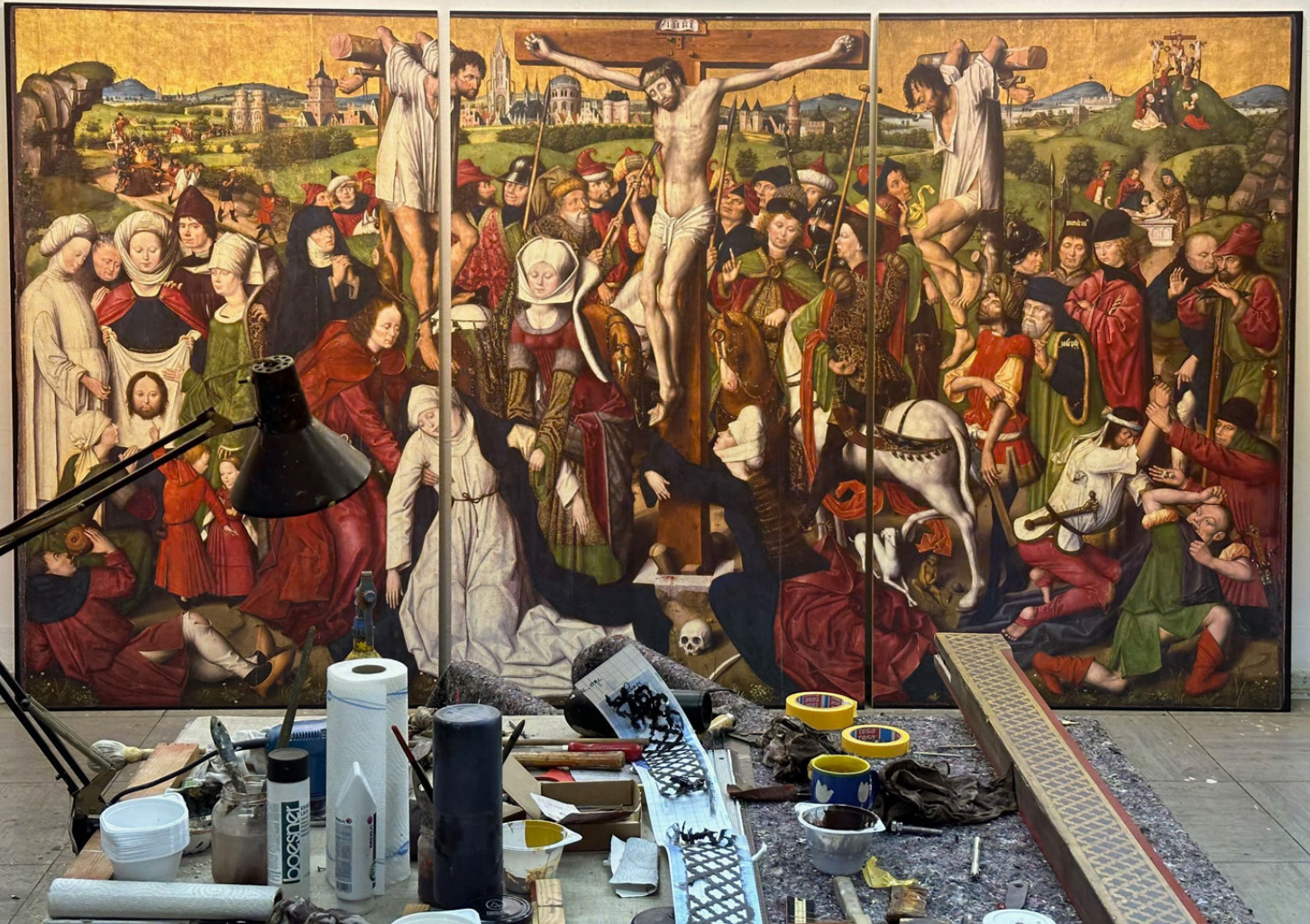
Abb.: Ateliersituation mit Tafeln von Jan Baegert