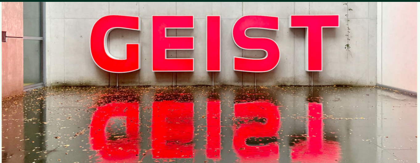
Abb. Via Lewandowsky, Das Versprechen , 1963

Pünktlich zu den Kreis Klever KulTourtagen hat der Freundeskreis unter dem Titel Geist, Geister, geistreich eine ansprechende Anleitung entwickelt, die Kinder und Eltern zu einigen Highlights der ständigen Sammlung des MKK führt. Das Material für einen spielerischen Rundgang gibt es ab dem 20./21. Mai an der Kasse des MKK. Viel Spaß allen Besuchern beim Ausprobieren!