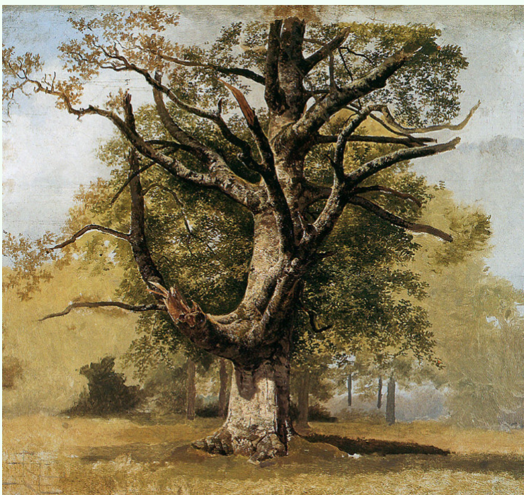
Abb. B.C. Koekkoek, Große Buche vor Schloss Moyland , 1840

Bomen over Bomen oder Bäume über Bäume , so der Titel der Ausstellung Museum Staal in Almen in den benachbarten Niederlanden. Hier trifft man während der Umbauphase im BCKH auf Werke B.C. Koekkoeks, des berühmtesten Waldlandschaftsmalers seiner Zeit. Auch zeitgenössische Künstler thematisieren das Thema Baum. Also auf „in de Achterhoek“, zu jeder Jahreszeit.