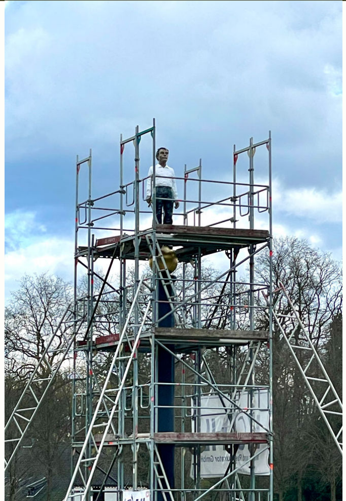
Abb.: Stephan Balkenhol, Der Eiserner Mann, 2004, (eingerrüstet)