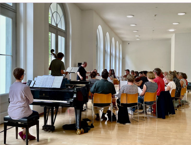
Abb.: Kammerorchester und Kammerchor im Juli 2023