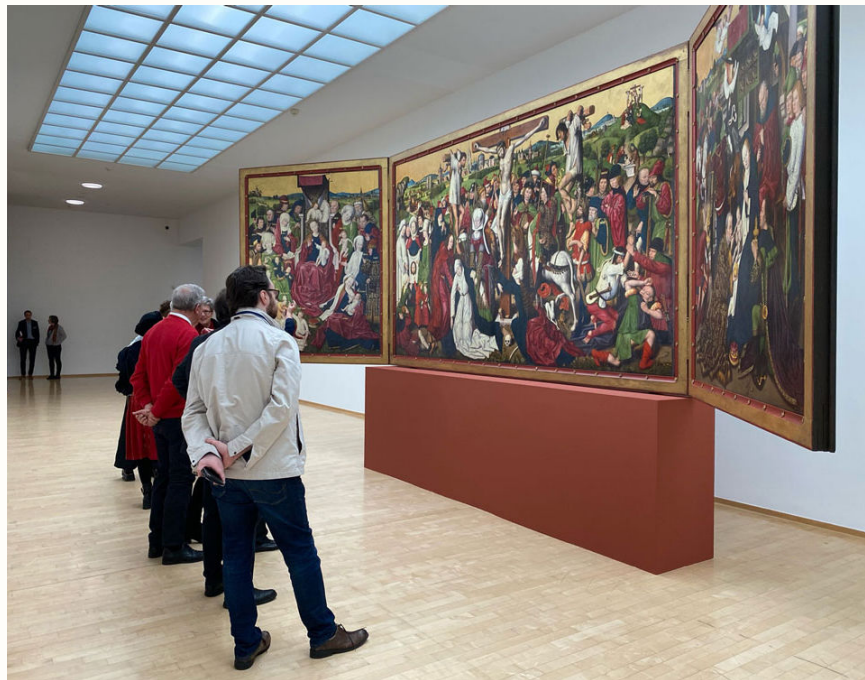
Abb.: Derick Baegert, Passions-Altar , Digitalisat der Julius Fröbus GmbH, Foto: Hubert Wanders