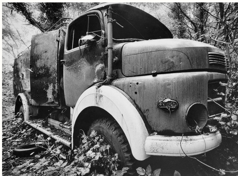
Feuerwehrauto