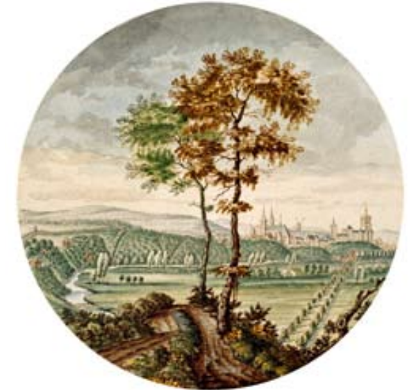
Jan van Call, um 1680/90 Blick vom Papenberg auf Kleve Aquarell, Durchmesser 105 mm Sammlung Angerhausen

frühen Beuys-Freundes Hanns Lamers auf. Entscheidend ist schließlich die Wiederherstellung der repräsentativen zweiläufigen Treppe, die ursprünglich das Erdgeschoss mit der Beletage und ihren eleganten Sälen verband. Mit der denkmalgerechten Restaurierung und behutsamen Erweiterung des Friedrich-Wilhelm-Bades wird die Verwandlung des ehemaligen Klever Kurhauses in ein Museum abgeschlossen. Die Stadt erhält das wichtigste architektonische Zeugnis aus der Blütezeit von ›Bad Cleve‹ zurück – und den Ort, an dem Beuys zu dem wurde, der er war.